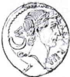
Fig. 1. – Iuliu Cezar. Zeitschrift für Numismatik . IV, p. 143.

lemn de foc, și pentru a găti mâncarea, și pentru a păzi uneltele casei”, și el le arată născând în câmp și întorcându-se cu copilul în poală, „de parcă nu l-am născut, ci l-am găsit”. Pare că ar fi vorba de țărăncile noastre până astăzi. În ce privește această strămutare păstorească, e interesant și faptul că numai în românește grupul de oi se cheamă turmă , cuvântul având în limba latină un sens exclusiv militar.